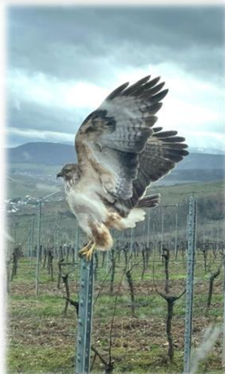
Prise au Neuland à WESTHALTEN

Pour plus d'informations, s'adresser au secrétaire de Mairie 03.89.47.69.11 - secretaire.mairie@westhalten.fr